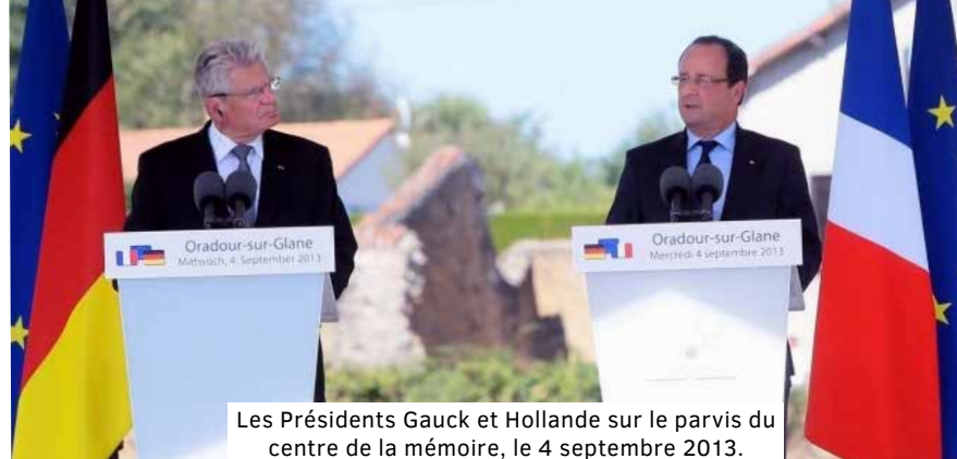
Les Présidents Gauck et Hollande sur le parvis du centre de la mémoire, le 4 septembre 2013.